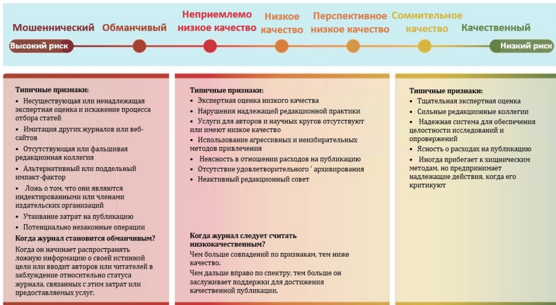
Рисунок 1: Спектр хищнического поведения для журналов