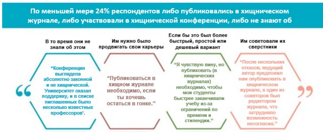
Рисунок 4: Причины использования хищнических услуг, сознательно или неосознанно

Респонденты в странах с низким и средним уровнем дохода чаще сообщали, что они использовали хищнические методы или не знали, использовали ли они их, в отличие от респондентов в странах с более высоким уровнем дохода; и хотя этап их академической карьеры не имел существенного значения, респонденты в некоторых дисциплинах оказались более уязвимыми, чем другие.